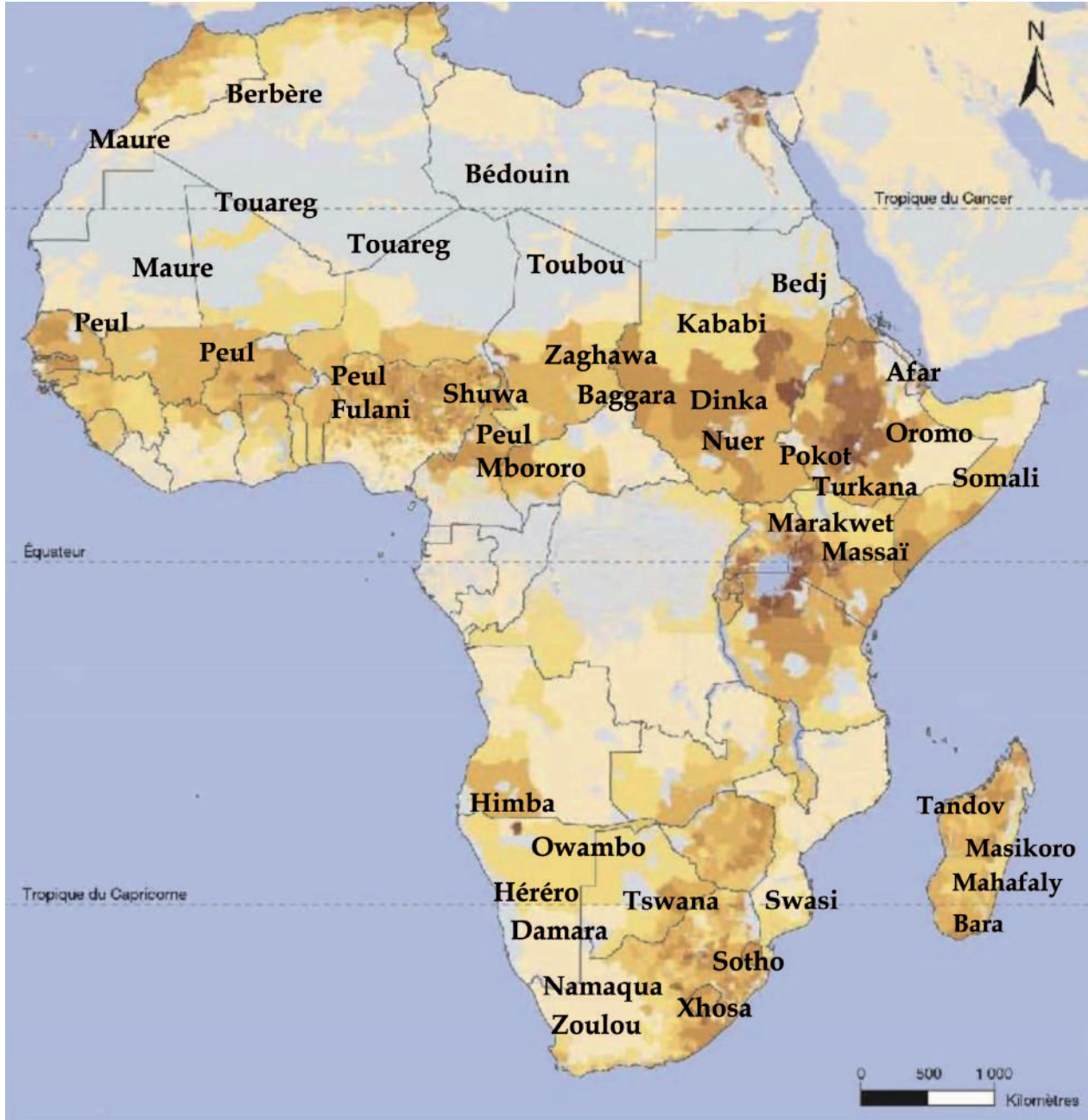
Carte 1. Les communautés pastorales en Afrique 1