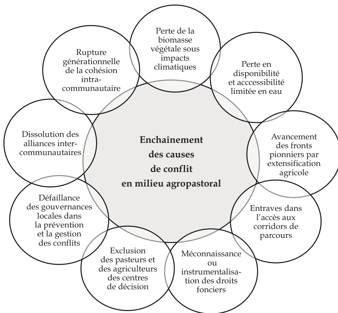
Figure 2. Une combinaison de facteurs de conflits

Afrique, on retrouve toujours une combinaison de facteurs associant la mise en cause des équilibres anciens dans la gestion des communs et des échecs institutionnels répétés pour prévenir ou résoudre les conflits. Nous proposons une synthèse des facteurs susceptibles de configurer les conflits (fig. 2).