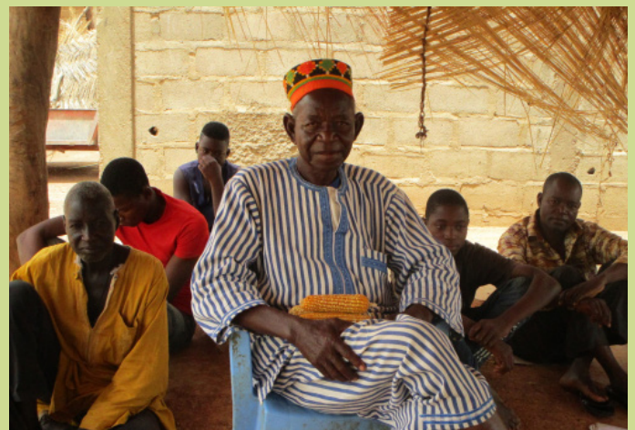
Chef coutumier et ses sujets

La principale difficulté est la rareté de la pluie. Cela a un impact sur nos productions. Pour remédier à ce problème d'eau, nous allons utiliser, cette année, la technique du zaï. Chaque producteur doit avoir au moins un demi-hectare de zaï dans son champ. En plus de la pluie, il y a aussi les produits phytosanitaires. Ces produits dégradent énormément nos sols. Pour résoudre ce problème, c'est à nous, producteurs, de trouver des solutions pour protéger nos terres.