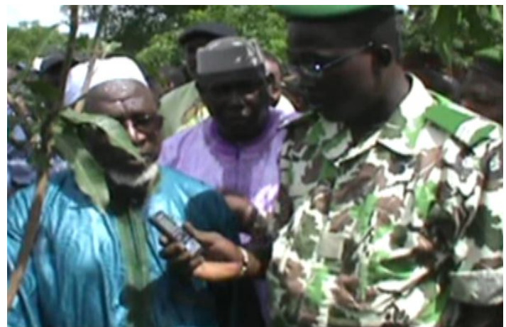
Interviews du Président de l'APCAM et du Président de l'ADACOM