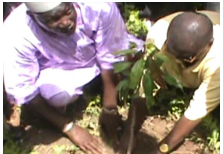
Plantation symbolique par le Président de l'APCAM