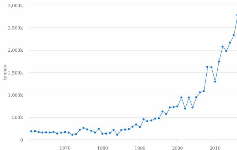
Evolution de la production de riz paddy au Mali de 1960 à 2016, (FAOSTAT)

Performances des filières riz. On assiste depuis une décennie à un véritable « boom » du riz dû à une croissance des surfaces mais aussi des rendements (cf schéma :). Cette croissance a été permise par des investissements importants dans l'irrigation à grande échelle dans l'Office du Niger, à l'amélioration de l'accès au crédit agricole et aux subventions des intrants dans ce même périmètre, à la diffusion de la pratique du repiquage des plants, à l'introduction de nouvelles variétés. Depuis 2008, le riz pluvial s'est également fortement développé (avec la variété NERICA) dans le Sud, autour de Sikasso et Koulikouro. Malgré ces atouts, le Mali n'est pas encore autosuffisant en riz : on estime que la production locale couvre 93% des besoins nationaux et que l'Etat peine à contrôler les importations. De même la transformation du riz reste encore peu développée. Depuis la période des ajustements structurels, les rizeries industrielles ont laissé la place à des décortiqueuses et des mini-rizeries peu performantes gérées soit par des OP, soit par des opérateurs privés. Elles prennent en charge 80% du riz transformé aujourd'hui.