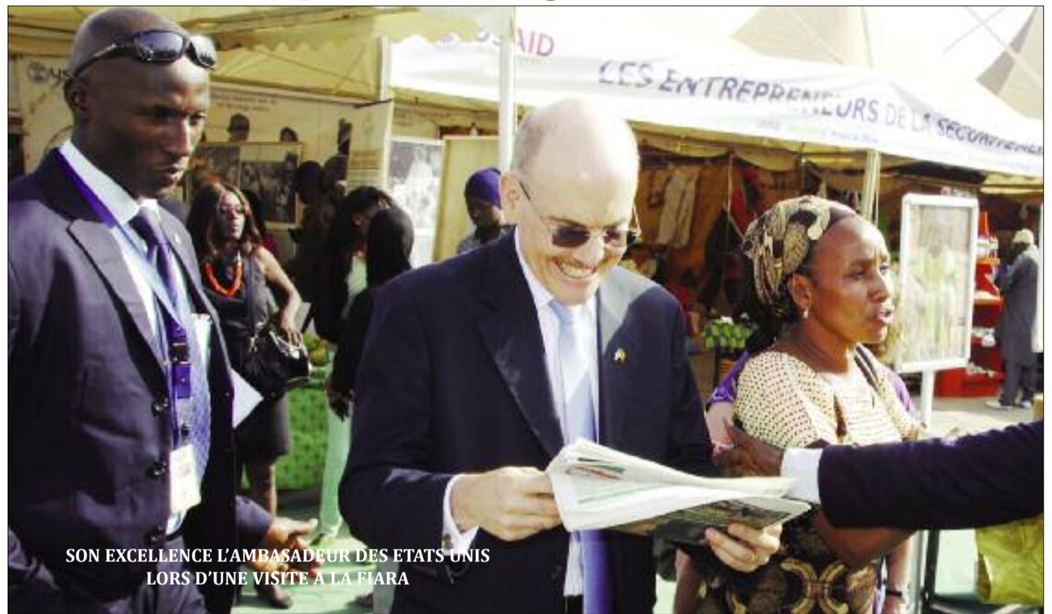
SON EXCELLENCE L'AMBASADEUR DES ETATS UNIS LORS D'UNE VISITE A LA FIARA

Le défi majeur de cette initiative est de permettre à 18 millions de femmes, d'enfants, de familles vulnérables, de petits