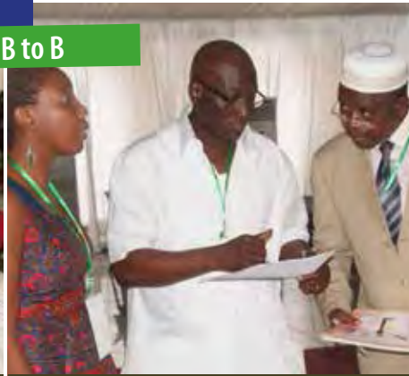
Séance de briefing