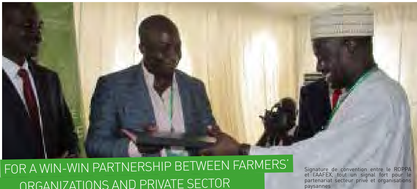
Signature de convention entre le ROPPA et l'AAFEX, tout un signal fort pour le partenariat secteur privé et organisations paysannes

de ce partenariat commercial, il y a un autre partenariat non moins important qui est un partenariat stratégique et institutionnel entre nos deux organisations que nous pouvons d'ores et déjà considérer comme des organisations sœurs ». Des paroles réconfortantes et une dynamique déjà en marche pour un partenariat fructueux entre organisations paysannes et secteur privé. ■