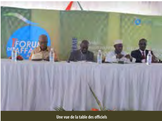
Une vue de la table des officiels