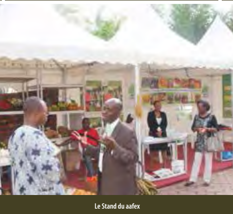
Le Stand du aafx