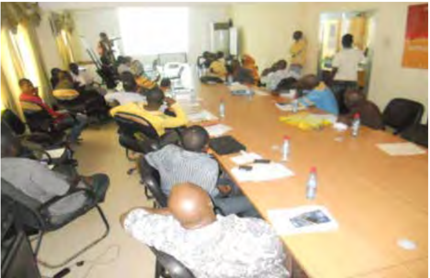
Une vue des participants à l'Atelier de Plaidoyer sur le budget du Libéria A pictorial (excerpt) from the Liberia Budget Advocacy Workshop