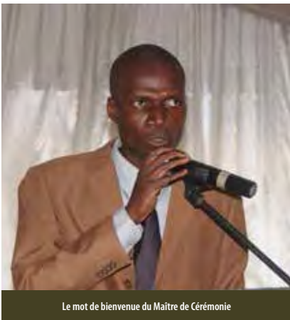
Le mot de bienvenue du Maître de Cérémonie