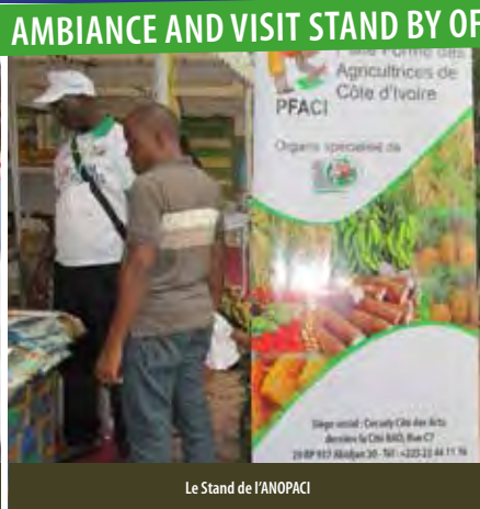
Le Stand de l'ANOPACI