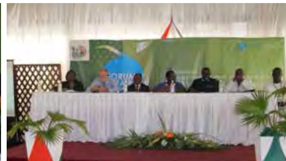
Vue des conférenciers du Panel 2