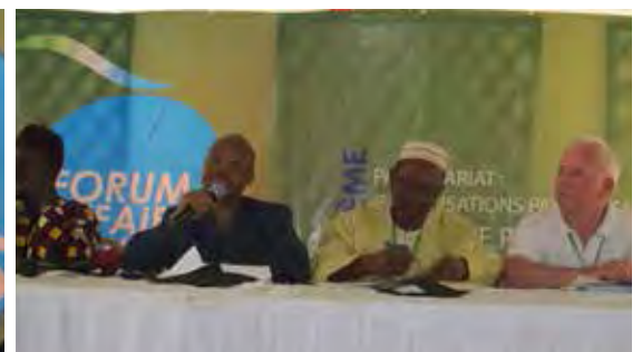
Vue des conférenciers du Panel 3