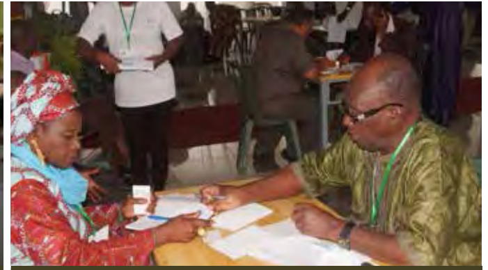
Les échanges de contacts entre les participants