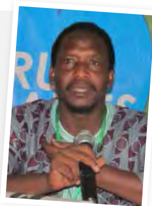
PIERRE METONOU , PRESIDENT OF THE COMMITTEE OF CEREALS GROWERS OF BENIN

«I think this forum is the first and the idea was not to contract this time. The idea was to test the ground to see what we have and what we can do. And we realize that there are very good things. Whenever we asked farmers to organize themselves and especially when the prices are a little bit stable people are involved and they can live with dignity in their work. The agricultural sector can absorb all the unemployment in our region if there is a good policy. To do this, we need to invest a lot of money. For B to B meetings, it was a first. There are a lot of products we can develop and bring to market. Many things we can sell abroad but for that everyone must play his role. The farmer's role is to produce and he needs to live on his production. He must have earnings and recover his production costs. The economic operator shall do the rest. He can process the production, and collects its gain. So everyone wins and it is this principle to be preferred. This forum is opened to different types of stakeholders: tools manufacturers, farmers, processors, financial partners as well. These stakeholders have an important place because without funding nothing good can happen. This is a market dynamics that we launched and I think this is a future dynamics. We must continue, persevere. I think this forum is one of the largest in Africa in the coming years».