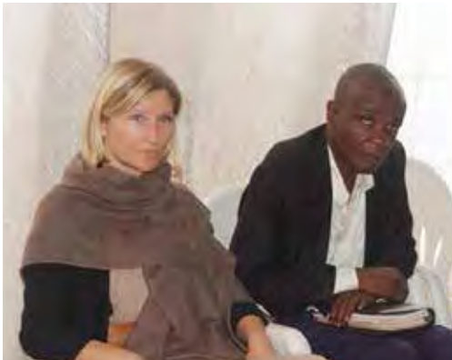
La représentante de GROW AFRICA