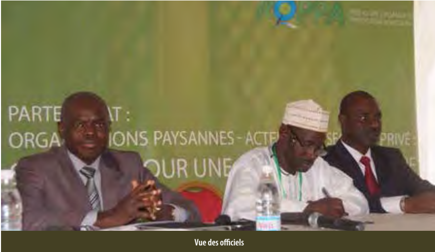
Vue des officiels