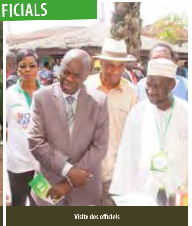
Visite des officiels