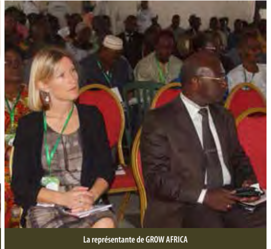
La représentante de GROW AFRICA