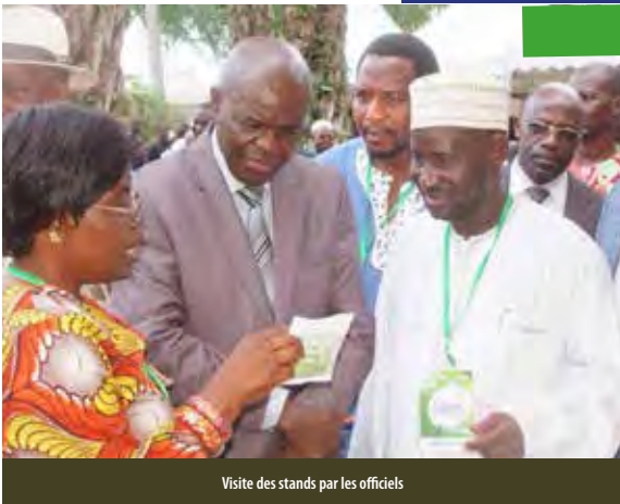
Visite des stands par les officiels