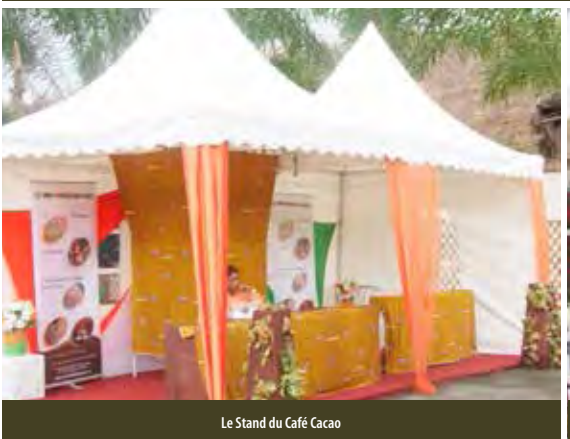
Le Stand du Café Cacao