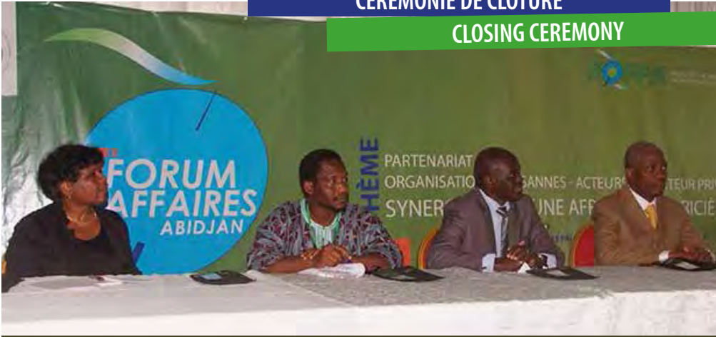
Vue des Officiels