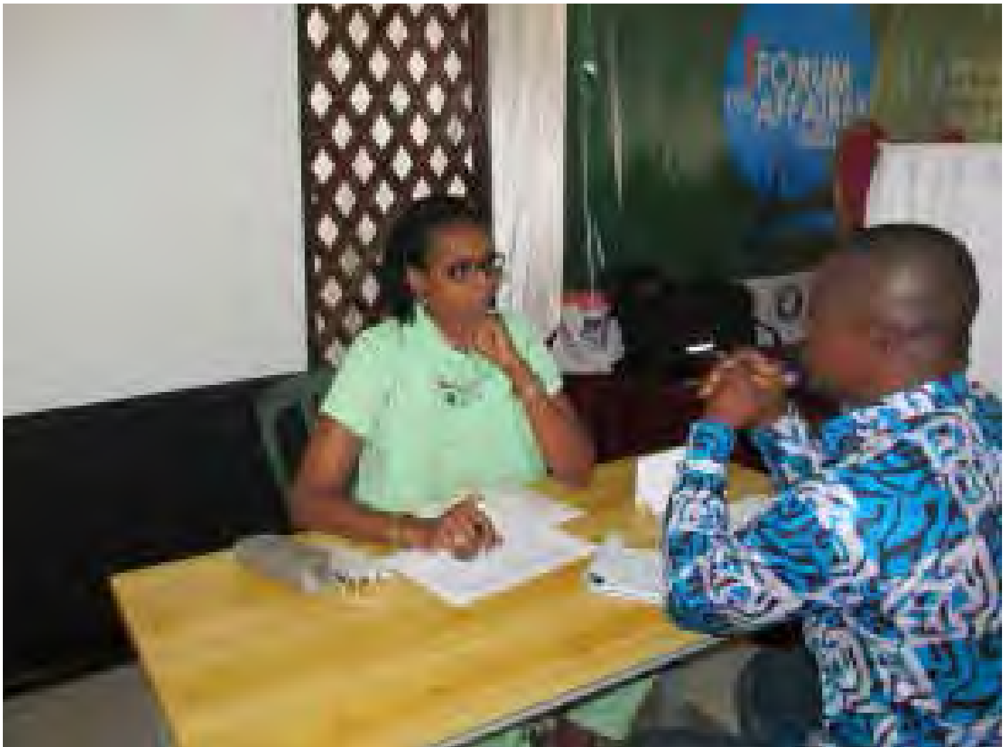
Séance B to B pendant le forum Session B to B during the forum

«We discussed with partners, we had promises and we consider the results in the case of Mali are interesting. I am happy because it is the culmination of the training we have received from 23 to 27 October 2013. On food processing, seeds and productivity, we can say that there is success. We should multiply this kind of activity that brings producers and processors in the industry. B to B will enable to keep in touch and linking between subregional coordination and partners».