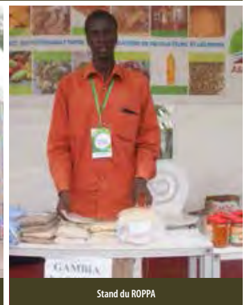
Stand du ROPPA