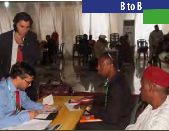
Echange entre participants