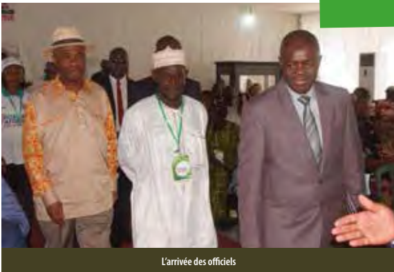
L'arrivée des officiels