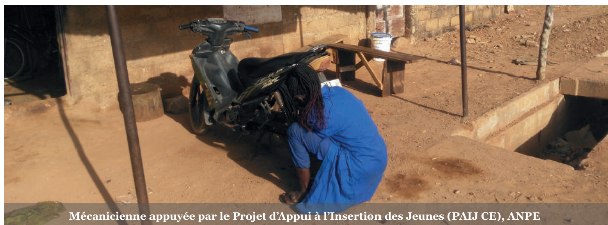
Mécanicienne appuyée par le Projet d'Appui à l'Insertion des Jeunes (PAIJ CE), ANPE

En effet, l'ambition d'Enabel en matière de genre est d'atteindre 85 % de programmes marqueur 1 selon l'OCDE d'ici 2025 pour un monde durable où les femmes et les hommes s'épanouissent pleinement. Cette ambition est en droite ligne avec la stratégie 2030 d'Enabel qui envisage le développement du secteur privé et l'appui à l'entrepreneuriat comme un des leviers de réduction des inégalités et la stratégie Genre #WeforHer qui promeut une double approche ( double-track approach ), combinant l'intégration transversale du genre dans ses programmes ( gender mainstreaming ) ainsi que des actions spécifiques visant la réduction des inégalités de genre. Ainsi, Enabel met en place des actions d'appui à l'entrepreneuriat féminin, soit sous forme de projet à part entière soit sous forme d'actions ciblées dans le cadre de programmes destinés à tou-tes les entrepreneur-es. Une attention particulière est portée au niveau de la sélection des bénéficiaires de ces activités pour assurer que les femmes entrepreneures aient accès aux services proposés.