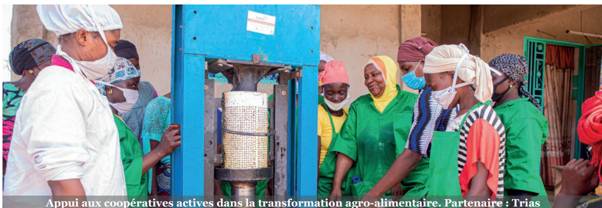
Appui aux coopératives actives dans la transformation agro-alimentaire. Partenaire : Trias