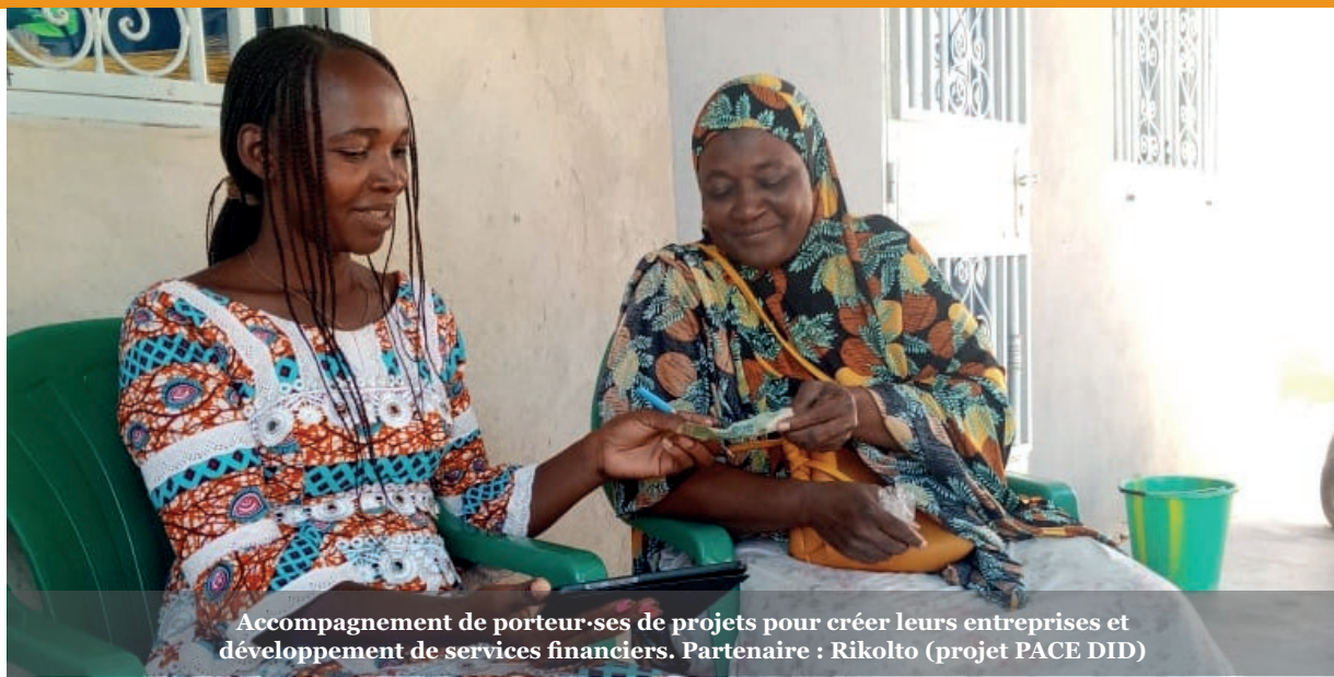
Accompagnement de porteur-ses de projets pour créer leurs entreprises et développement de services financiers. Partenaire : Rikolto (projet PACE DID)