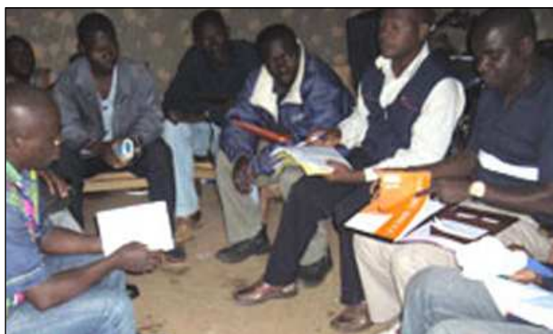
Séance de travail dans la case d'un producteur de Mankono. Il pleut dehors!

De Bouaké à Boundiali, elle a échangé avec des autorités, des responsables locaux des sociétés cotonnières, des faitières, des producteurs et visité des champs et des usines. Les échanges ont porté sur les enjeux du prêt intrants BID, la subvention des engrais, le rôle des structures qui composent la mission, la nécessité de concertations entre principaux acteurs pour la relance de la filière.