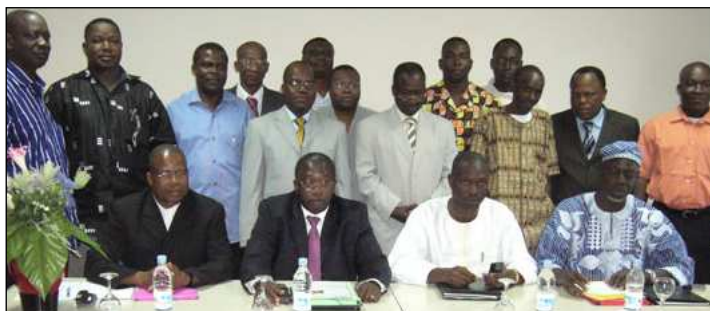
Photo de famille des participants et invités.

permis une fois encore à ces spécialistes de comparer, partager et d'actualiser leurs données en vue de mieux orienter la stratégie de lutte contre l'héliotis et les autres parasites redoutables du cotonnier qui hantent les cotonculteurs de la sous région.