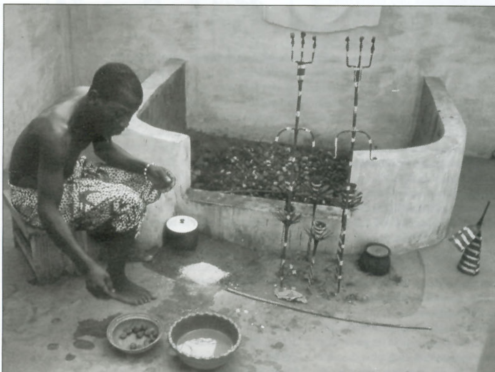
Orstom - C. Brun

Dans tout le Sahel, la cola est un élément de cohésion sociale.