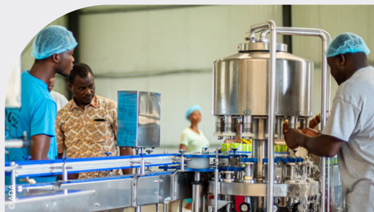
Afrik Excel, une entreprise spécialisée dans la production et la transformation de fruits biologiques à Adangbé, partenaire de la FUCEC dans le cadre d'un contrat tripartite.