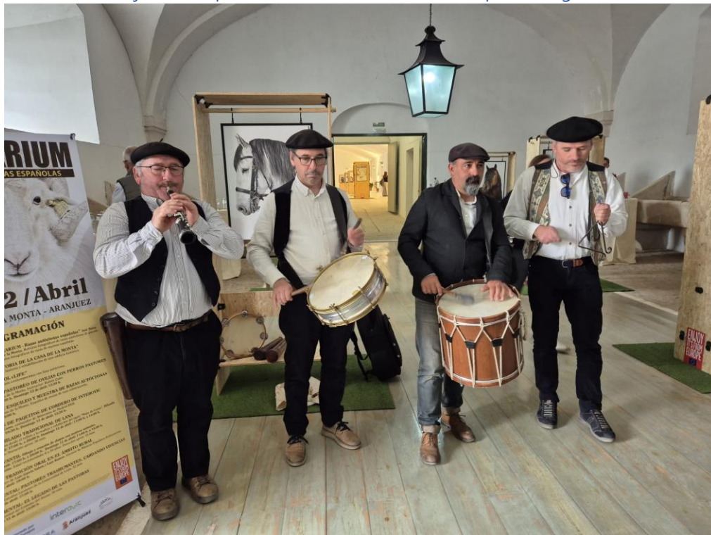
Aranjuez, 11 April 2026: musicians with a repertoire of traditional popular songs, playing simple instruments (the flute, the tambourine, the drum and triangle) at festivals. In the room was the exposition of Bestiarium: Big pictures of all native breeds of Spain (horses, cows, sheep, goats, dogs, chicken, pork and turkeys) used by pastoralists (also during transhumance)