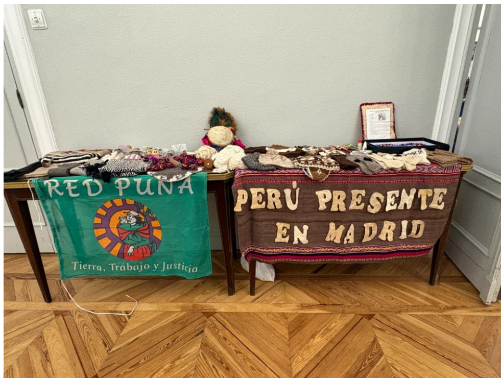
Madrid, 9 April 2026. Shepherdesses from the Andes brought objects of sheep wool (left - Argentina) and Alpaca wool (right - Peru), they had woven themselves