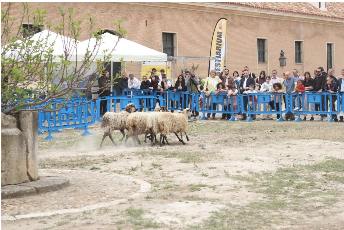
Aranjuez, 11 April 2026: Demonstration of dogs herding livestock