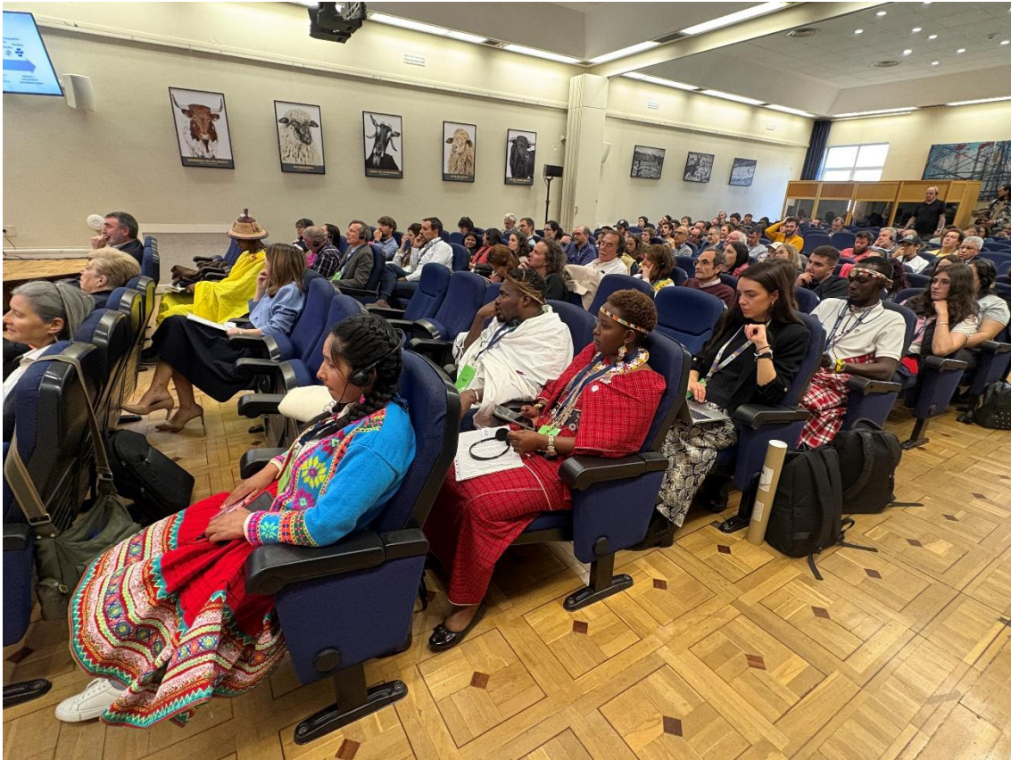
Madrid, 9 April 2026: during the event 200 persons were attending in presence and 200 in remote