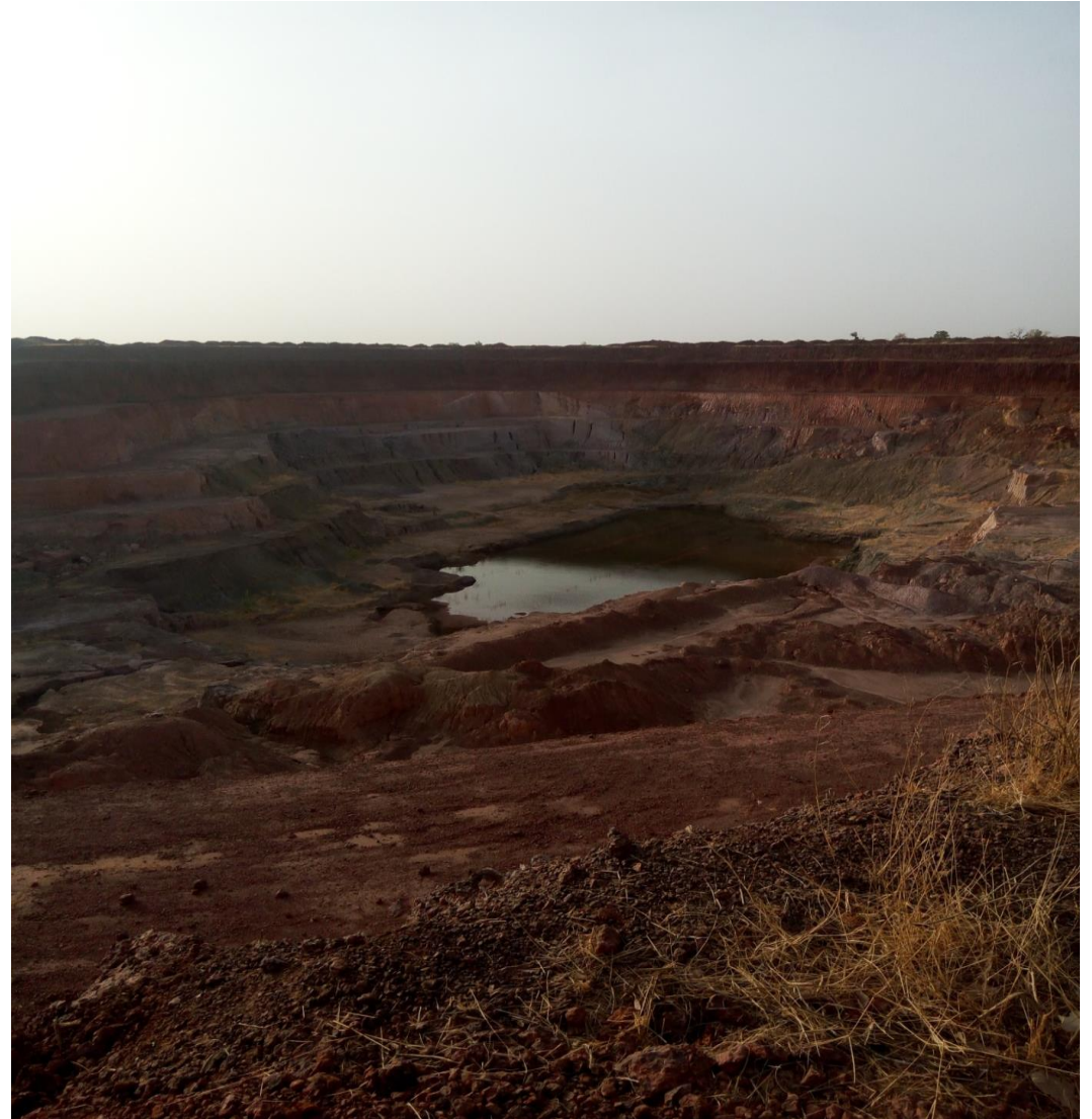
Photographie mai 2018, à proximité du site de Samira (Niger) : fosse profonde non-clôturée sur un espace à vocation pastorale