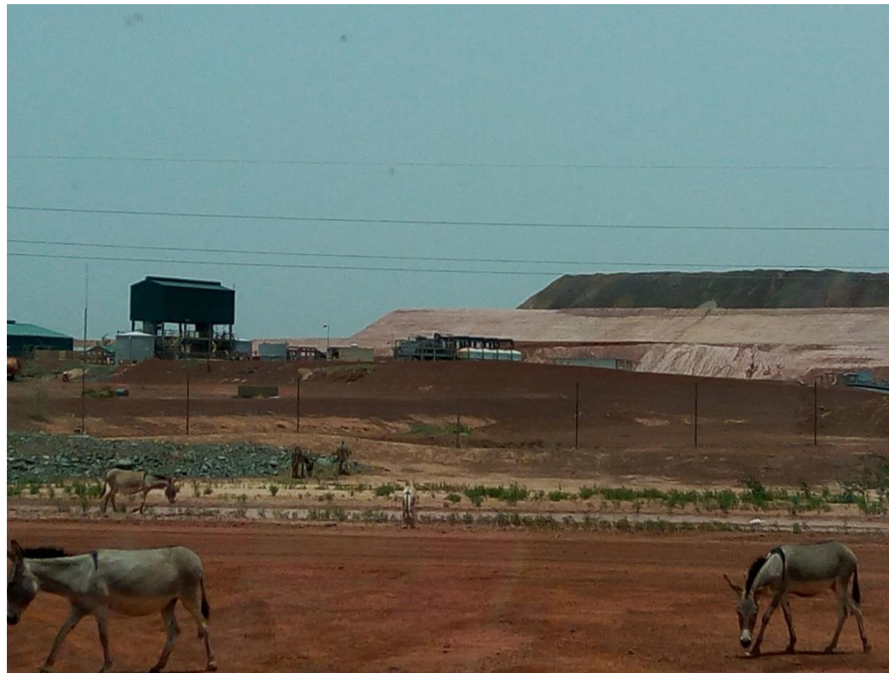
Photographie mai 2018, site de Bissa (Burkina Faso) : emprise foncière du site principal encadrée par une clôture