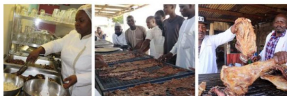
Restaurants, dîbiteries, transformateurs de viande séchées, etc.

Les Jeunes Ambassadeurs du Pastoralisme sont issus des organisations paysannes et pastorales de 9 pays du Sahel et de l'Afrique de l'Ouest. Militants pour la défense des intérêts du pastoralisme, ils animent actuellement une campagne de communication intitulée « Les 1000 métiers dans les zones pastorales ». Une série de publications Facebook illustrées présente les différents métiers liés au pastoralisme : vétérinaires, professionnel.le.s de la chaîne du froid, transformateurs et formatrices de viande, vendeurs et vendeuses d'herbe, garant.e.s... L'élevage pastoral fait vivre des dizaines de métiers différents, tous indispensables au bon fonctionnement de la filière.