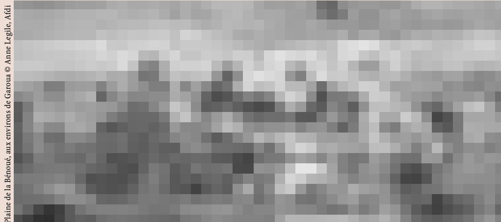
Plaine de la Bénoué, aux environs de Garoua

À travers ces trois exemples, le défaut de politique foncière étatique mis en lumière se fait au profit des chefferies traditionnelles. Les intervenants sur le foncier se trouvent ainsi privés d'une tutelle administrative. Le biais technique de projets sous couvert d'une société para-étatique, la Sodecoton, a montré ses limites. Un combat incertain se poursuit à travers les comités diocésains de développement. Quant à la société civile, si elle s'organise dans les villes, elle peine à se reconnaître dans les autorités peules. Sans tutelle de l'État pour les politiques foncières, comment espérer la mise en œuvre de solutions intermédiaires, entre codes et pratiques locales ? ■