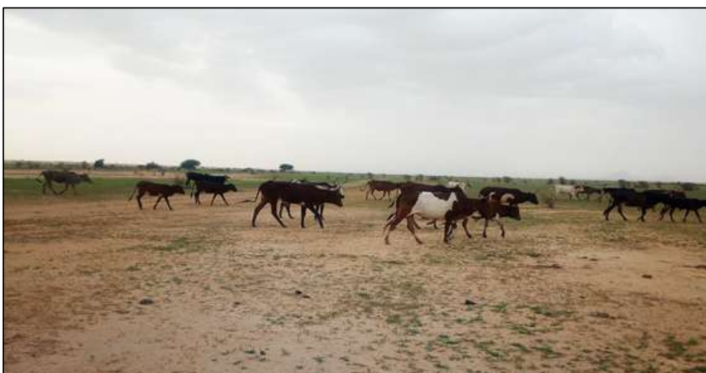
Troupeau de bovins transhumant au Tchad