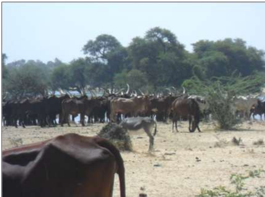
Troupeau de bovins en transhumance sur le Niger