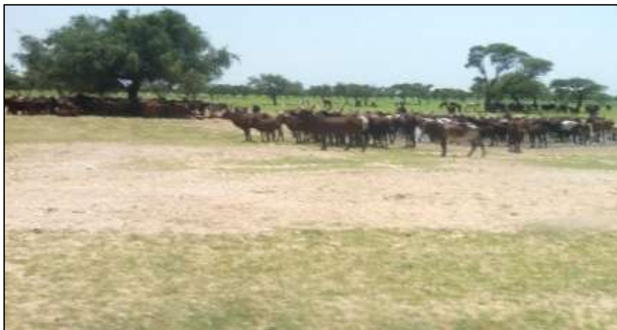
Troupeau de bovins en transhumance sur le Niger

A l'intérieur de la Région, on signale le retour progressif des pasteurs ayant effectués la transhumance et le nomadisme hors de leur terroir d'attache.