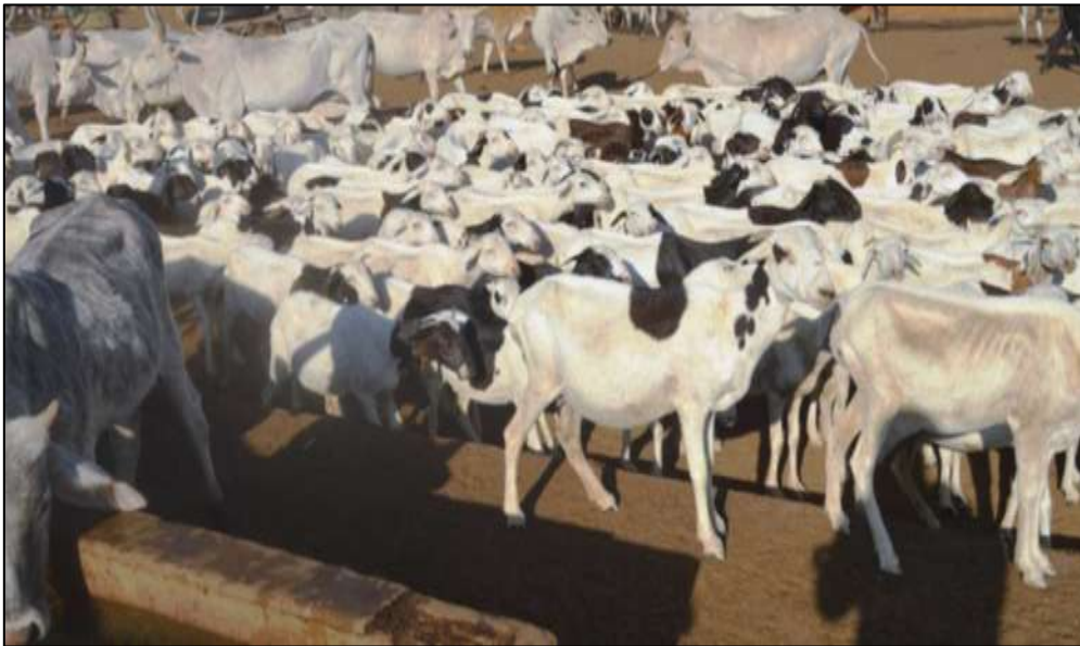
Animaux au marché à bétail en Mauritanie