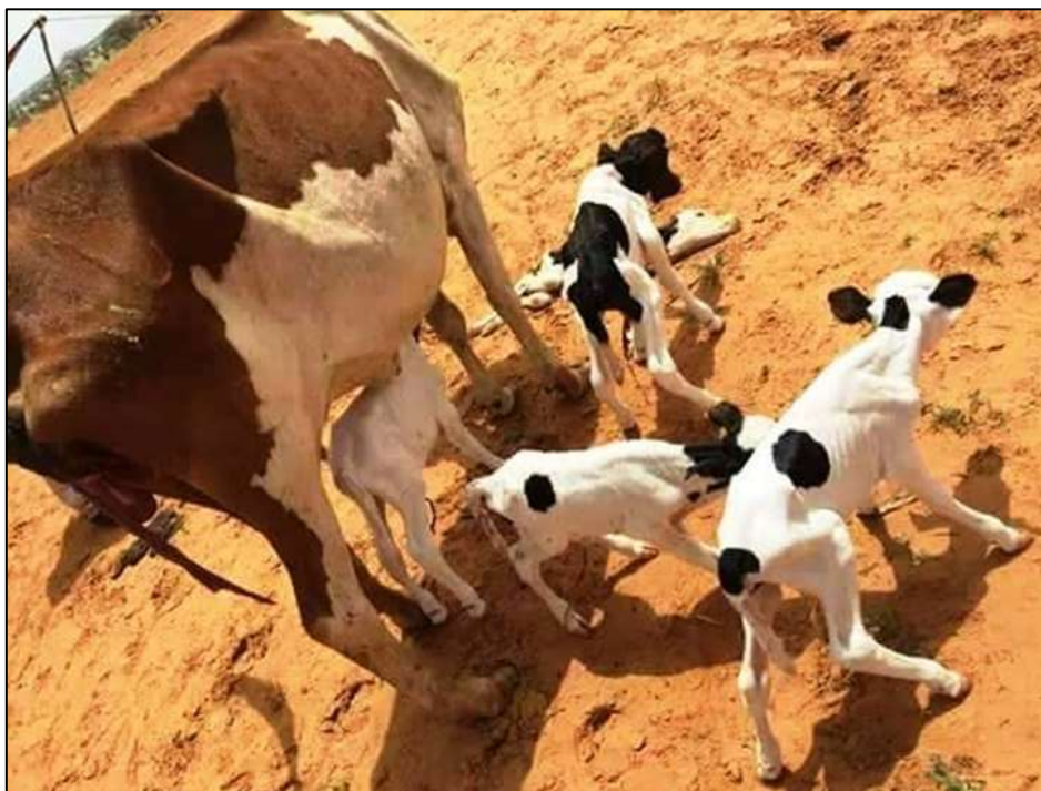
Bovins au Mali