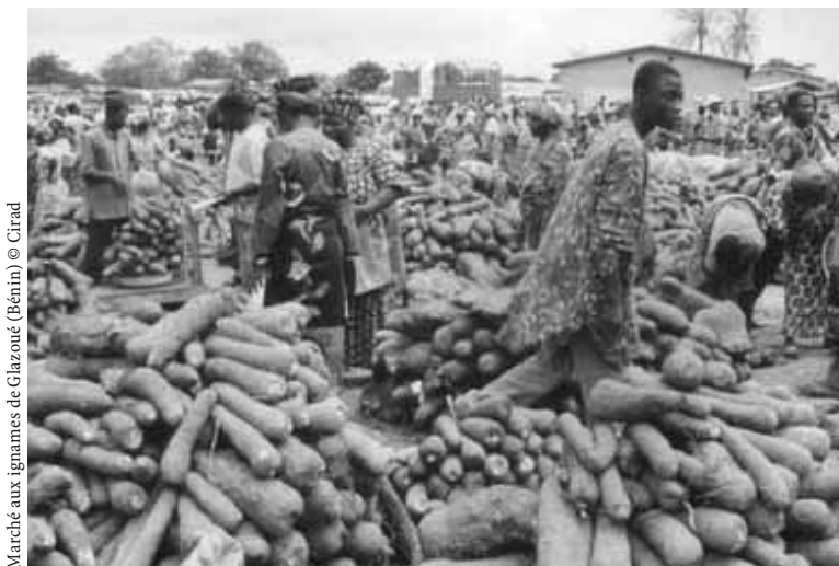
Marché aux ignames de Glazoué (Bénin)

« LES PRODUITS LOCAUX RESTENT TRÈS APPRÉCIÉS ET CONSOMMÉS EN VILLE »