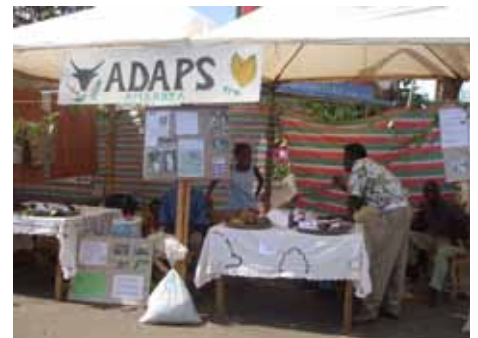
Ny vokatrin'ny ADAPS tao amin'ny Foara Meva

Nitombo ho 24 ny isan'ny kaoperativa mpikambana ao amin'ny ADAPS raha 14 izany teo aloha. Isan'ny mampiroborobo izany ny fambolena kakao sy ny voly legioma. Atsy ho atsy dia hisokatra ny sampana any Nosy Be satria efa misy ireo fikambanana vitsivitsy nijoro any antoerana. Hitsangana tsy ho ela koa ny vovonan'ireo kaoperativa ao amin'ny ADAPS izay hifototra indrindra amin'ny varotra iombonana. Nandray anjara mavitrika tamin'ny foara meva ny ADAPS.