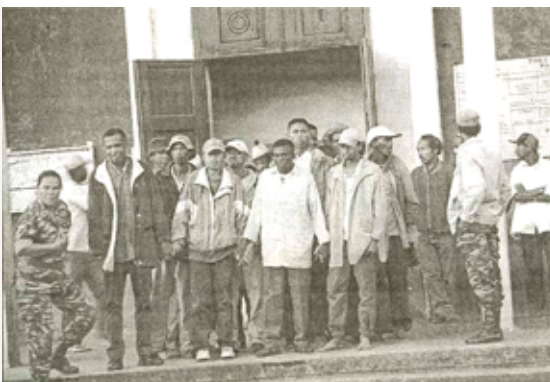
Tantsaha 93 niatrika fitsarana tao Miarnarivo (sary nalaina tao amin'ny Gazety EXPRESS)

Ady tany : Tantsaha 13 voaheloka ho faty P 2