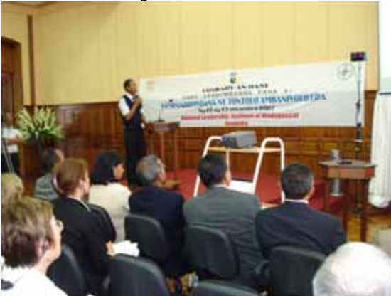
Nifandimby nandray fitenenana ireo solotena teny lavoloha

Loabary an-dasy: Niaka-dapa teny lavoloha ireo solotenan'ny tantsaha P 5