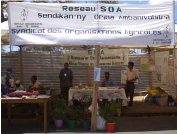
FANDRAISANA ANJARA TAMIN'NY FOARA MEVA