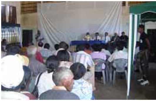
Feno hipoka ny tranompokonolona tao Analavory

Nahaliana ireo mponina tao Analavory tokoa ny varavarana misokatra ho an'ny fananan-tany nataon'ny Sehatra lombonana ho an'ny Fananan-tany ny talata 18 desambra 2007 lasa teo. Ireo tany vita soratra nefa narian'ny tompony no lohahevitra tamin'izany. Maro tokoa mantsy ireo tanin'ny Mpanjanaka vazaha no nilaozan'ny tompony amin'ny faritra iny. Ary satria tena mahavokatra ny tany dia maro ireo mpifindra monina no nanorom-ponenana tany. Vitsy anefa ireo nahavita nahasoratra ny tany ka lasa zary olana tokoa ho an'ireo mpiavy nahavita nanoratra ara-dalana ny tany. Rehefa nihaino ny zava-misy sy nitondra fanazavana ny SIF sy ireo tompon'andraikim-panjakana dia niara nikahondoha teto Antananarivo. Nivoaka tamin'izany ireto soso-kevitra maro izay raha fehezina dia ny fandrindrana ny fanapahan-kevitra raisina sy ny lalana misy, ny fisian'ny mangarahara sy ny fivoizam-baovao amin'ny fananan-tany ary ny fandraisana ny hevitra eny ifotony.