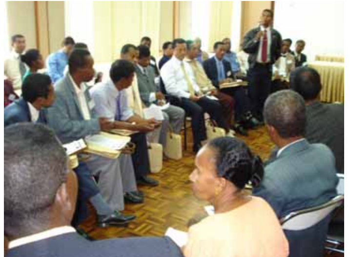
LOABARY AN-DASY NIARAHANA TAMIN'NY FILOHAM-PIRENENA