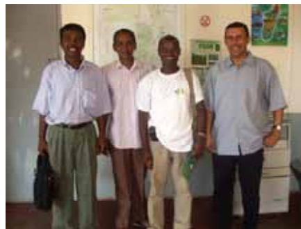
Fiaraha-miasa amin'ny PSDR MENABE

Mihitatra amin'ny distrikan'i Manja iny ny faritra iasan'ny FITAME. Miroborobo toa izany koa ny fiaraha-miasa amin'ireo ankolafin-kery samihafa indrindra amin'ny voly kabaro. Nahavokatra masomboly kabaro fotsimaso voamarina manodidina ny 50 taonina ny FITAME tamin'ny taom-pamokarana lasa iny. Heverina ny hampitombo ny vokatra araka izay tratra noho ny fisokafan'ny tsena vokatry ny fifanarahana teo amin'ny fanjakana Maorisianina mpandray ny vokatra sy ny fitondrampanjakana Malagasy.