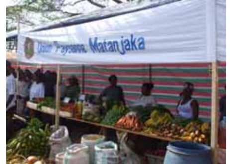
Tranohevan'ny Vovonana MATANJAKA

Lany 90 % ireo vokatra netin'ireo fikambanana tantsaha avy ao amin'ny vovonana Matanjaka na dia tsy dia nahomby loatra aza ity foara natao tao Antsiranana ity. Ny olana lehibe nitranga moa dia ny fahamafisan'ny varatraza tamin'ny fotoana nanaovana ny foara ny ka 26-28 oktobra 2007.