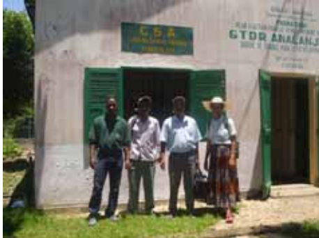
Fidinana ifotony natao tany amin'ny TARATRA

Miroso hatrany amin'ny ezaka fanatsarana ny famokarana ireo voly fanondrana ny TARATRA. Efa maro ireo kaoperativa najoro, tsy maintsy jerena anefa ny tena aha-matihanana azy ireny.