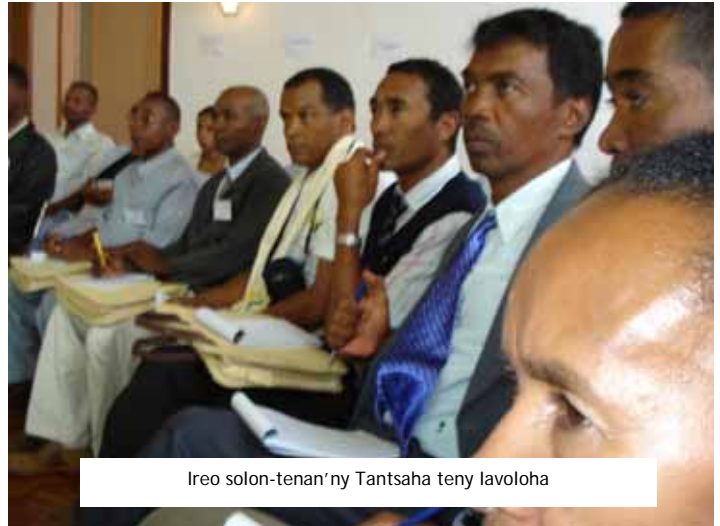
Ireo solon-tenan'ny Tantsaha teny lavoloha

Dian y fitondrana ireo hetahetan'ny Tantsaha manerana ny nosy tokoa no naroso teny lavoloha satria dia noresahana tamin'izany ny olana sy ny vahaolana manodidina ireo zava-manahirana ankehitriny: ny famatsiam-bola eny Ambanivohitra, ny fitaovam-pambolena, ny masomboly, ny zezika, ny lalam-barotra ... Heverina fa ny fiaraha-nikahon-doha tamin'ireo mpandraharaha eny ambanivohitra sy ireo mpanohana ara-bola sy ara-teknina ary ireo ankolafin-kery rehetra dia ahafahana mamaritra fiaraha-miasa mahomby ho an'ny fampandrosoana ny Tontolo Ambanivohitra .