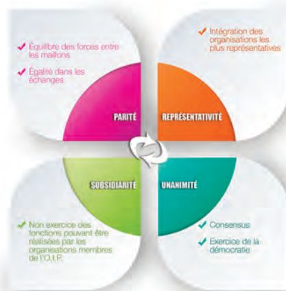
FIGURE 2: PRINCIPES GÉNÉRAUX DES OIP SOUS LE MODÈLE FRANÇAIS

Quatre grands principes sont généralement relevés : la parité, la représentativité, la subsidiarité et l'unanimité.