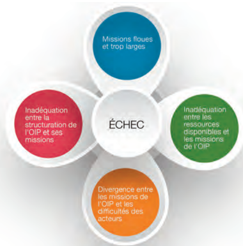
FIGURE 4: LIMITES DANS LA DÉFINITION DES MISSIONS DES OIP

Au Sénégal par exemple, la mission de représentation et de dialogue politique est tant bien que mal réussie par certaines, notamment dans le cadre de la défense des intérêts moraux et matériels de l'OIP.