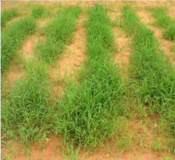
Champ de fonio

Donc pour aller au bout de notre logique, nous avons décidé de lancer une production en bio pour que le fonio soit sain une fois pour toutes. Nous sommes parvenus à renouveler deux fois de suite cette certification et celle en cours expire en mars 2021. Pour toutes ces raisons, le fonio est intéressant aussi bien pour le marché burkinabé, ouest-africain, qu'international.