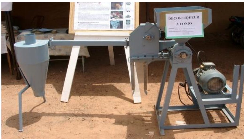
Décortiqueur à fonio mis à disposition pour les transformatrices par Aprossa

Il existe un certain nombre d'exigences pour développer une chaîne intégrale de production en bio. L'inspection a lieu au champ, mais aussi au niveau de la logistique (stockage, transport, etc.) et de la transformation. La certification de l'unité de transformation est impérative, qu'elle soit rurale ou urbaine. Traditionnellement, les producteurs vendent leur fonio à leurs épouses, qui le décortiquent. Dans le cas d'Aprossa, utiliser ce réseau de transformatrices rurales aurait été difficile car il aurait fallu qu'elles soient également certifiées bio, ainsi que leur matériel de transformation. En outre, comme elles font le décorticage manuellement, elles traitent seulement de petites quantités. Pour de grandes quantités, il faudrait augmenter le nombre de transformatrices, et demander la certification pour chacune, ce qui aurait un coût considérable. Les transformatrices urbaines que nous accompagnons n'étaient pas prêtes à franchir le pas.