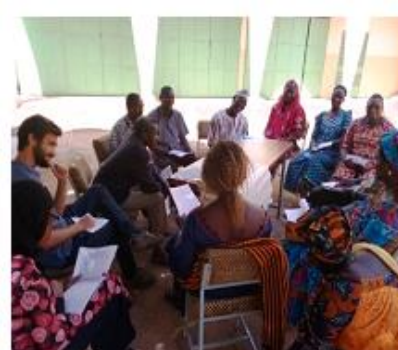
Atelier d'analyse de la chaîne de valeurs fonio dans la région des hauts Bassins